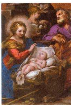
«NAVIDAD» La Natividad. Detalle. Óleo de Pietro Berrettini da Cortona (siglo XVII). Museo Nacional del Prado.