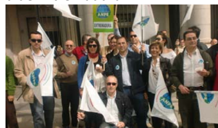
ANPE Extremadura ante el MEC por la jubilación anticipada

Con respecto al documento que hace unos días hizo público el Ministerio de Educación, ANPE Extremadura opina que es "incompleto" e "insuficiente" en algunos aspectos. Si bien es cierto contempla mejoras como la valoración del esfuerzo y evaluación del alumno o el carácter orientador de 4º de Educación Secundaria Obligatoria (ESO), el texto no recoge otros puntos que desde el sindicato consideran claves como es la mejora laboral y económica de los docentes o la prórroga de la jubilación anticipada. Es innegociable el hecho de que se prorrogue dos años más hasta que se regularice el futuro del Estatuto Básico del Funcionario Docente , de modo que ANPE no firmará en ningún caso un pacto en el que no se incluya esta medida.